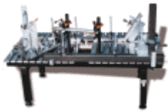
Tischfläche in GG 25